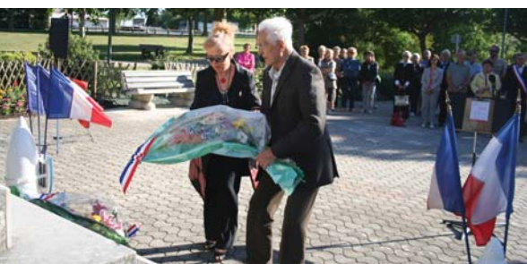
Dépôt de gerbe par l'ANACR

Le vendredi 27 mai, c'est autour du monument aux morts dans le square qui porte le nom d'un grand résistant portoais -René Ladet- que s'est déroulée la cérémonie commémorative du 68 ème anniversaire de la création du Conseil National de la Résistance.