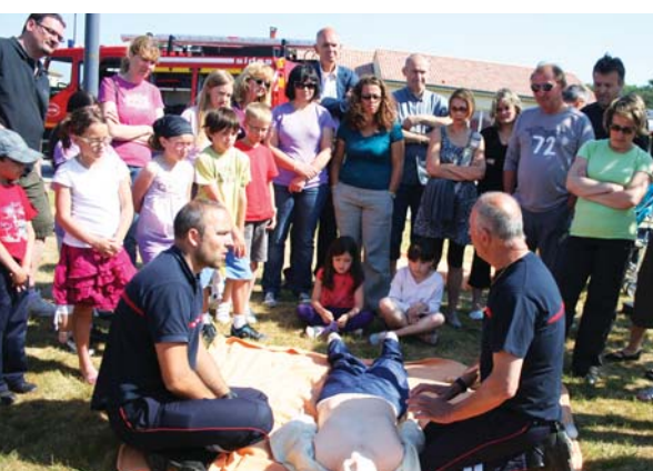
Apprentissage des premiers gestes avec les pompiers

L'une des raisons d'être des conseils de quartier est de créer du lien social. La démonstration en a été faite par les conseils de quartier Est-Les Chênes et Ouest avec une formation aux gestes d'urgence, un vide grenier et la fête du voisinage.