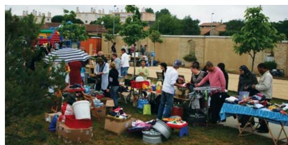
Le vide grenier du dimanche 5 juin

vous était donné place Maurice Caty pour un apéro et un repas en extérieur. Mais la pluie, tant attendue certes, avait également répondu à l'invitation. Tout le monde s'est alors replié dans la salle Fernand Léger pour un repas "sorti du sac" dans une ambiance chaleureuse et conviviale.