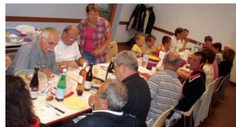
Au quartier Ouest, la fête du voisinage

Quarante-cinq stands étaient installés ainsi qu'un château gonflable pour le bonheur des enfants. Partenaire de cette initiative, la MJC-Centre social a présenté ses danses country tandis qu'on pouvait se désaltérer et se sustenter à la buvette. Le conseil de quartier Ouest avait, quant à lui, organisé "la fête du voisinage" le mardi 31 mai. Rendez-